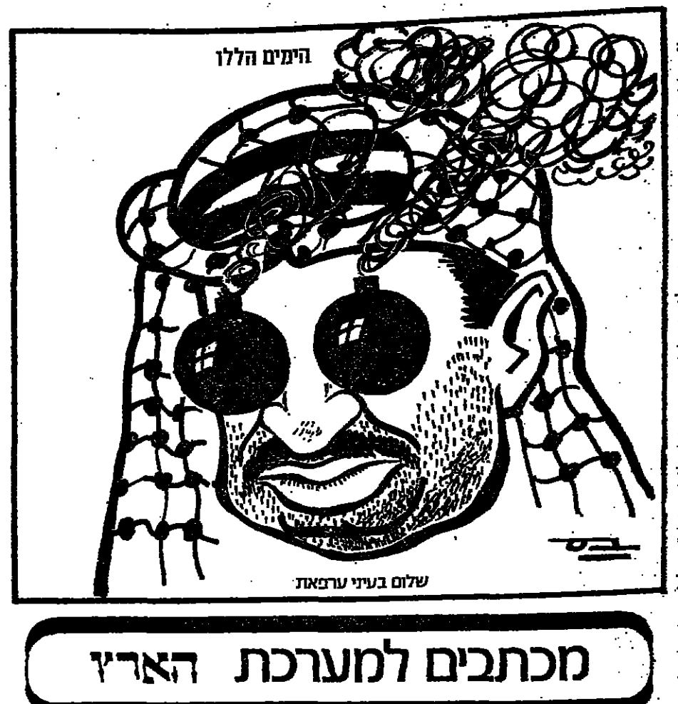
שלום בעדי ערמאט